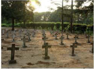
Begraafplaats Merksplas Kolonie