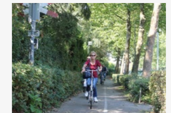
Fietspad 'Bels Lijntje'

Op de T-kruising van de Stationsstraat en de Kerkstraat staan twee routehuisjes. Deze hoorden vroeger bij de spoorlijn die hier lag. De spoorlijn Bels Lijntje 8 is zo genoemd omdat het door een Belgische maatschappij rond 1860 werd aangelegd. Oorspronkelijk werden zes keer per dag naast goederen ook personen vervoerd, maar toen er busverbindingen kwamen was dat niet meer rendabel en werd in 1934 het personenvervoer stopgezet. Tot 1973 reed er elke dag een goederentrein. Nu is het een toeristisch fietspad.