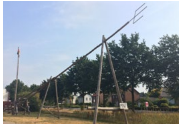
Replica van de zendmast