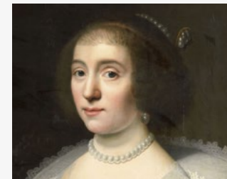
Amalia van Solms

Het lijkt bijzonder dat er in België een straat ligt, genoemd naar een prinses van Oranje. Amalia van Solms was prinses van Oranje, maar ook Vrouwe van Turnhout. Die twee titels stelden haar in staat om op een beslissend moment het voortbestaan van de Belgische enclaves te waarborgen.